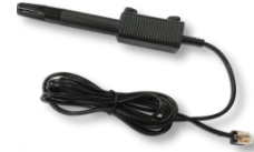
USB 轉無線 Wi-Fi